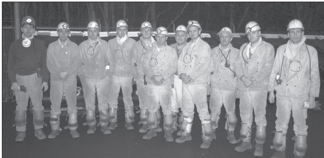
СПЕЦИАЛИСТЫ ШАХТЫ «ПЕРВОМАЙСКАЯ» С ПРЕДСТАВИТЕЛЯМИ КОМПАНИИ BUCYRUS В ГЕРМАНИИ.

- Весь ноябрь и декабрь мы вели прием работников. Отбор проводился очень тщательный, брали в основном грамотных специалистов, со стажем работы. Но при этом отдавали предпочтение молодежи, которая легче обучается, легче впитывает все новое, ведь струговая установка – это сплошная электроника. И еще один немаловажный момент – мощность пласта в струговой лаве один метр. В ней приходится не ходить, а ползать. Для этого надо быть