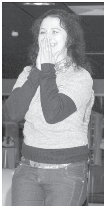
Эмоции через край (Е.Бутраева)

Елена ТРОФИМОВА Фото Татьяны ШЕПЕЛЬ-КУРОПАТОВОЙ